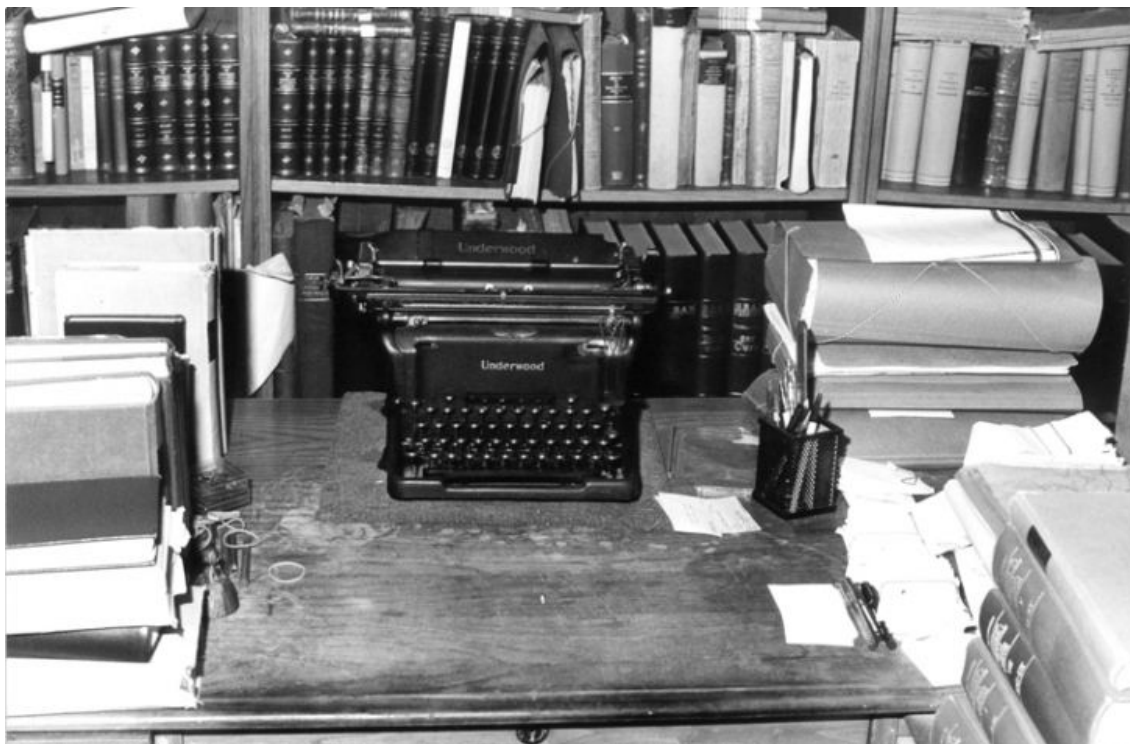
► Taula de treball de Joan Coromines. Pineda de Mar. Fundació Pere Coromines

Coromines, explicant la forma llonja enfront o al costat de llojja , afegia: “En el País Valencià i Mallorca la forma llonja no sols és legítima, sinó que no crec que ningú hagi pensat a blasmar-ne l’ús”. S’equivocava: molts valencians l’hem blasmat tant, que hem arribat a pensar –falsament– que l’única forma bona era llojja , i que l’altra era un banal castellanisme. I resulta que almorzar està documentat abans que esmorzar , i així de tantes ignoràncies nostres i dels altres, i d’alguns (només alguns) atacs feroços al Diccionari de l’Acadèmia Valenciana de la Llengua. Perquè alguns són sovint més papistes que el papa de Roma, a més de voler ser –cosa impossible– més unitaris i patriotes que el savi Joan Coromines.